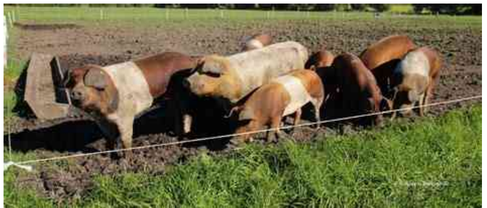
ÖTZ Zweinutzungsschwein

Wir freuen uns schon auf die neuen Mitbewohner!