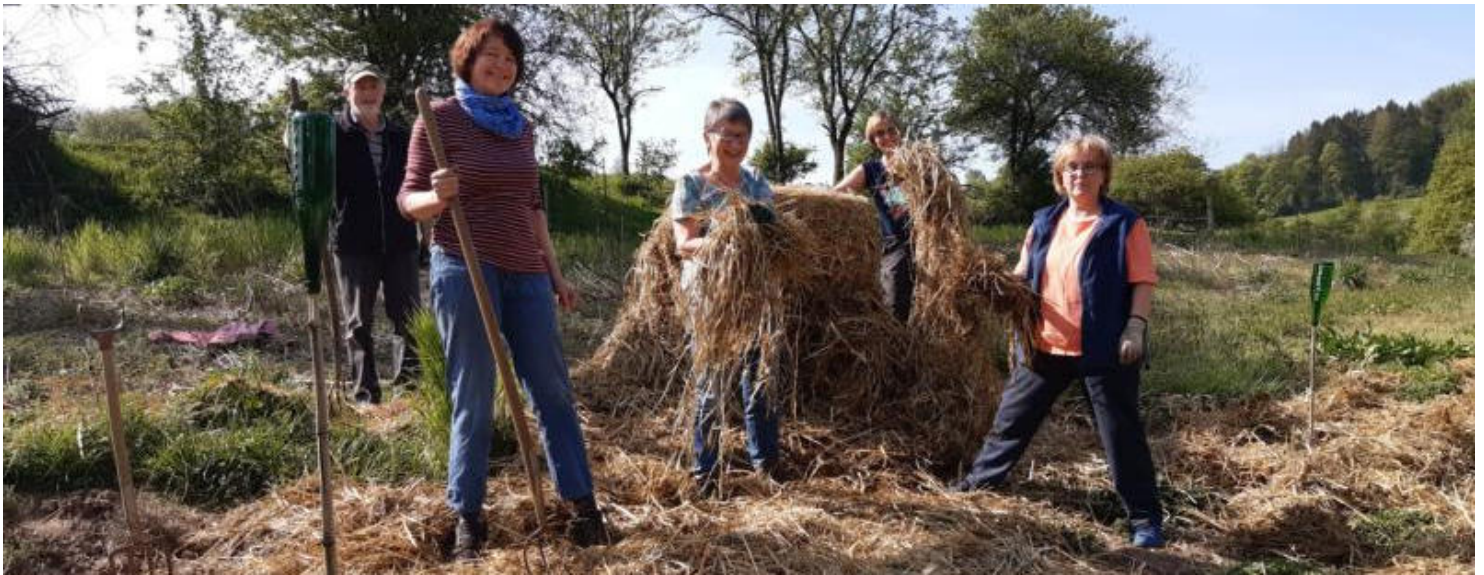
Ein Teil des Kräuterbeet - Teams bei der Arbeit. Vielen Dank an alle die sich um das Kräuterbeet kümmern!